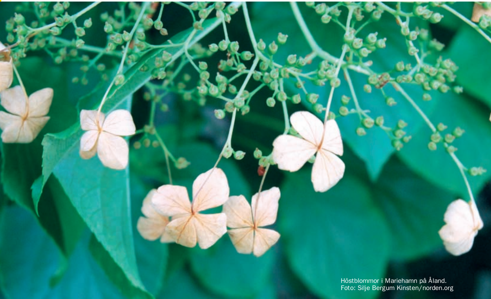
Höstblommor i Mariehamn på Åland.