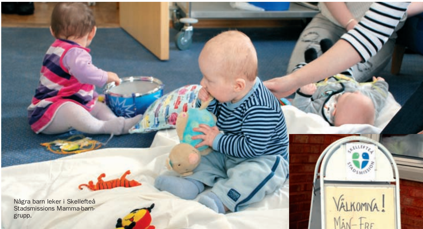
Några barn leker i Skellefteå Stadsmissions Mamma-barn-grupp.