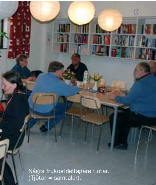
Några frukostdeltagare tjötar. (Tjötar = samtalar).